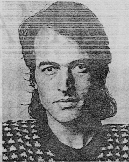
Rian Malan is in 1954 in Suid-Afrika gebore. Hy het as joernalis in Suid-Afrika en die Verenigde State van Amerika gewerk. Hierdie is sy eerste boek.

herrangskik om by sy storie te pas, is dit eweneens die amptelike genealoog van die Malan-familiebond se plig om op aansprake van Malan-